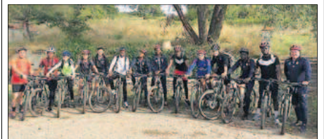
Les U17 du club ont enfourché les vélos et ont relié Cordes à Villefranche pour peaufiner leur préparation physique.

Samedi 1 er septembre aura lieu le premier entraînement de l'école de foot du Stade à 10 heures, au stade synthétique du Tricot. Si tu as entre 5 et 12 ans et que tu as envie d'essayer le football, viens nous rejoindre au Tricot. Cet entraînement est ouvert à toutes les filles et garçons, nés entre 2008 et 2014.