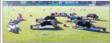
Après quelques jours de vacances, c'est l'heure de la reprise pour les membres de l'ACVR.

La fin des vacances s'approchant, le club d'athlétisme de l'ACVR reprendra ses entraînements le samedi 1 er septembre à 10h au stade H.Lagarde.