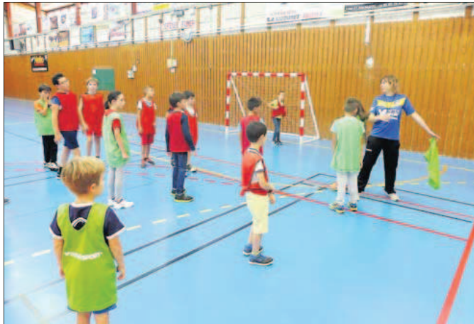
Comme l'année dernière, de nombreuses activités seront proposées au gymnase, à l'image du handball, de l'escrime, ou du badminton...

Cette matinée, permettra à tout un chacun de pouvoir s'adonner à sa discipline favorite, mais aussi de découvrir d'autres activités plus « méconnues ». Ainsi, durant la matinée du samedi 1 er septembre prochain, vous pourrez vous essayer au badminton, au tennis, tennis de table, basket, handball, volleyball, karaté, judo, zumba, gymnastique, taekwondo, escrime... dans la joie et la bonne humeur. Les dirigeants des clubs concernés seront, en effet, présents pour vous permettre de vous familiariser avec leurs activités, mais aussi pour vous fournir toutes les informations nécessaires si vous souhaitez les rejoindre. Bien sûr, cette journée sera gratuite et tout le monde pourra se balader de salles en salles pour tester les activités. Une belle initiative à l'orée d'une nouvelle saison sportive qui s'annonce, comme à l'accoutumée, très riche sur le territoire villefranchois. La municipalité a