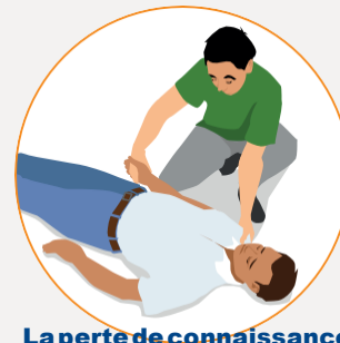
La perte de connaissance