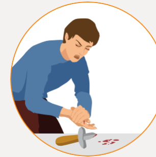
Les plaies et la protection