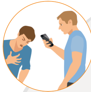
Le malaise et l'alerte

La journée est rythmée par des exposés, des ateliers d'apprentissage des gestes de premiers secours et de mises en situation.